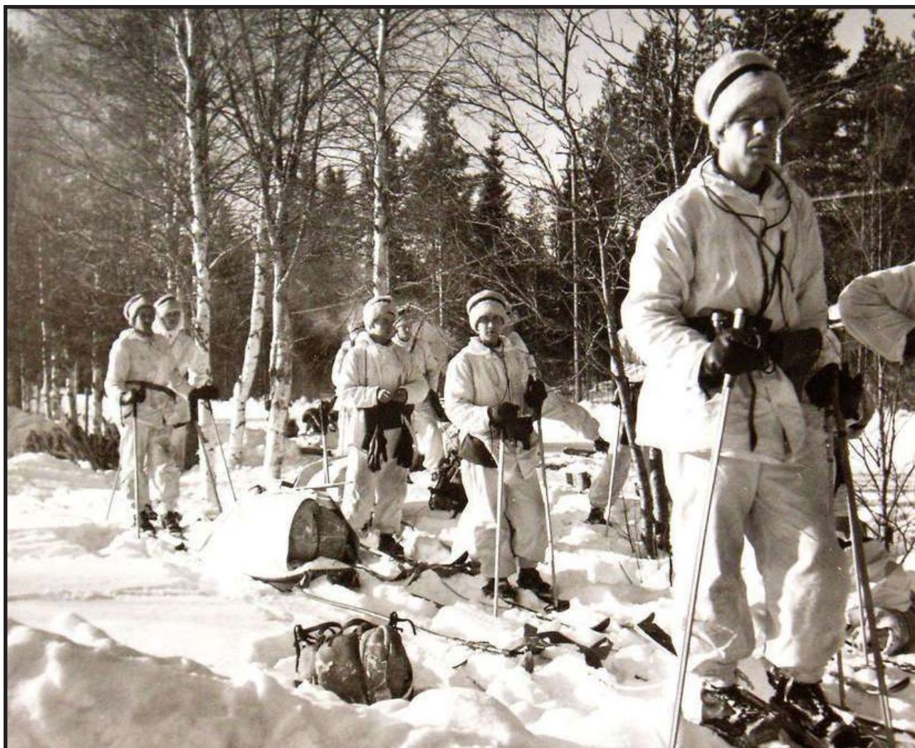
Krigsvintrarna runt 1940 var de kallaste i mannaminne. Skidåkning var ofta det snabbaste sättet att ta sig fram.