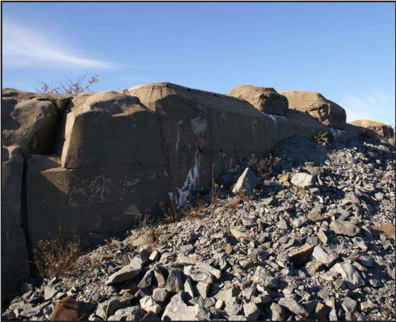
Befästningar på Singö.

Ett annat problem var tyska handelsfartyg som man ansåg snokade på sin väg till och från svenska hamnar. Större fartyg krävde lots och stod därmed under en viss kontroll, men mindre fartyg kunde ganska ostört göra sig en bild av kustförsvaret.