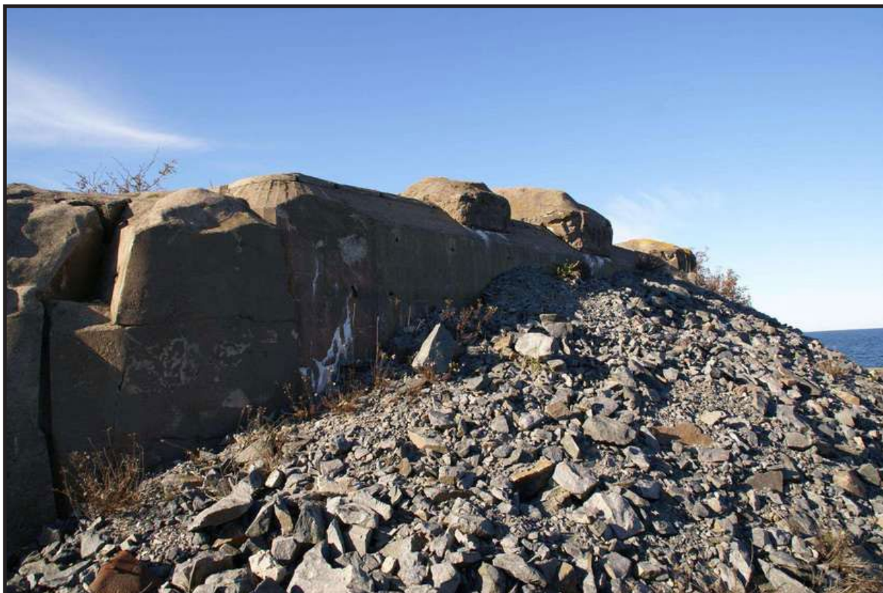
Befästningar på Singö.

Överste Rålamb beskrev även hur maskering av befästningarna skulle ske, för att försvåra upptäckt och om hur till exempel taggtrådshinder skulle byggas för att undvika stormning.