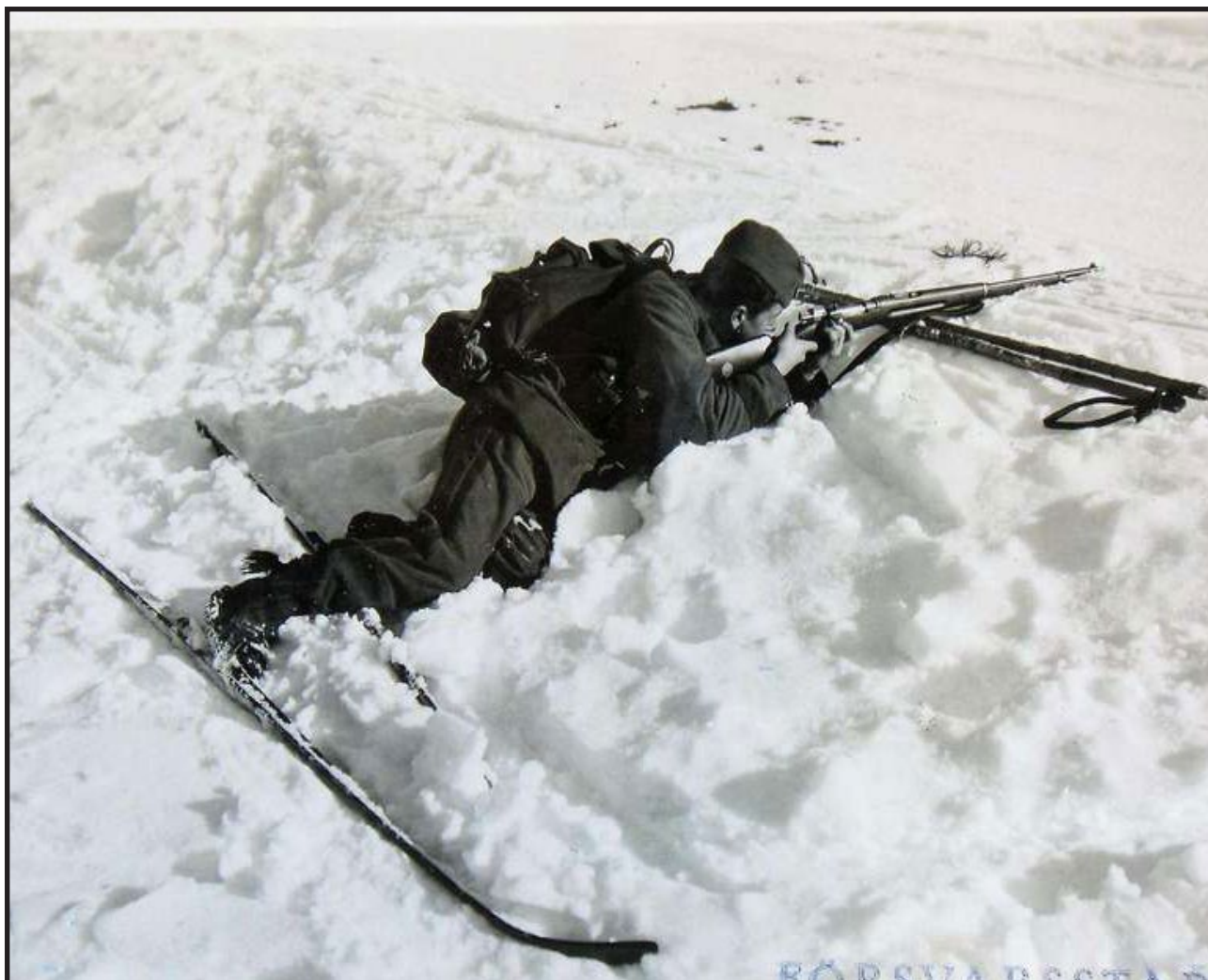
Skidpatrull på uppdrag tar sikte.

Om Sverige och Roslagen blev angripet skulle barn, gravida, sjuka och gamla evakueras. Det fanns förstås planer även för detta. Från tätorterna Norrtälje, Östhammar och Öregrund skulle cirka 2 000 personer utrymmas till mindre orter på den omgivande landsbygden.