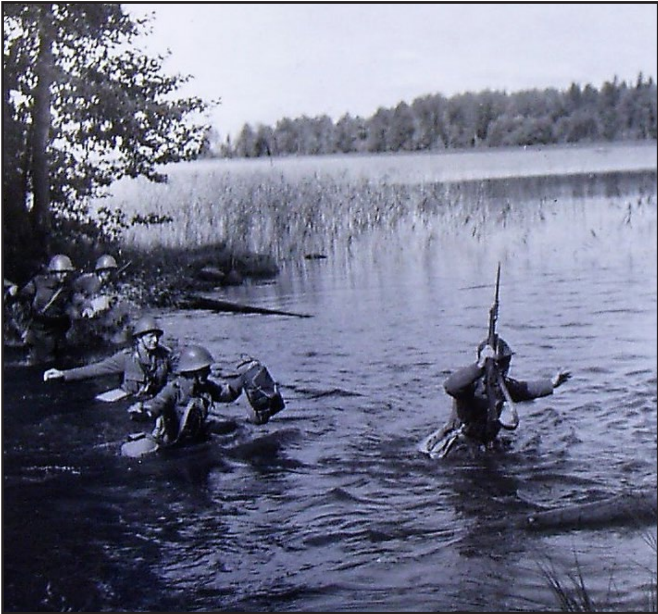
Omgruppering under försvarsövning. Från en ö till nästa.