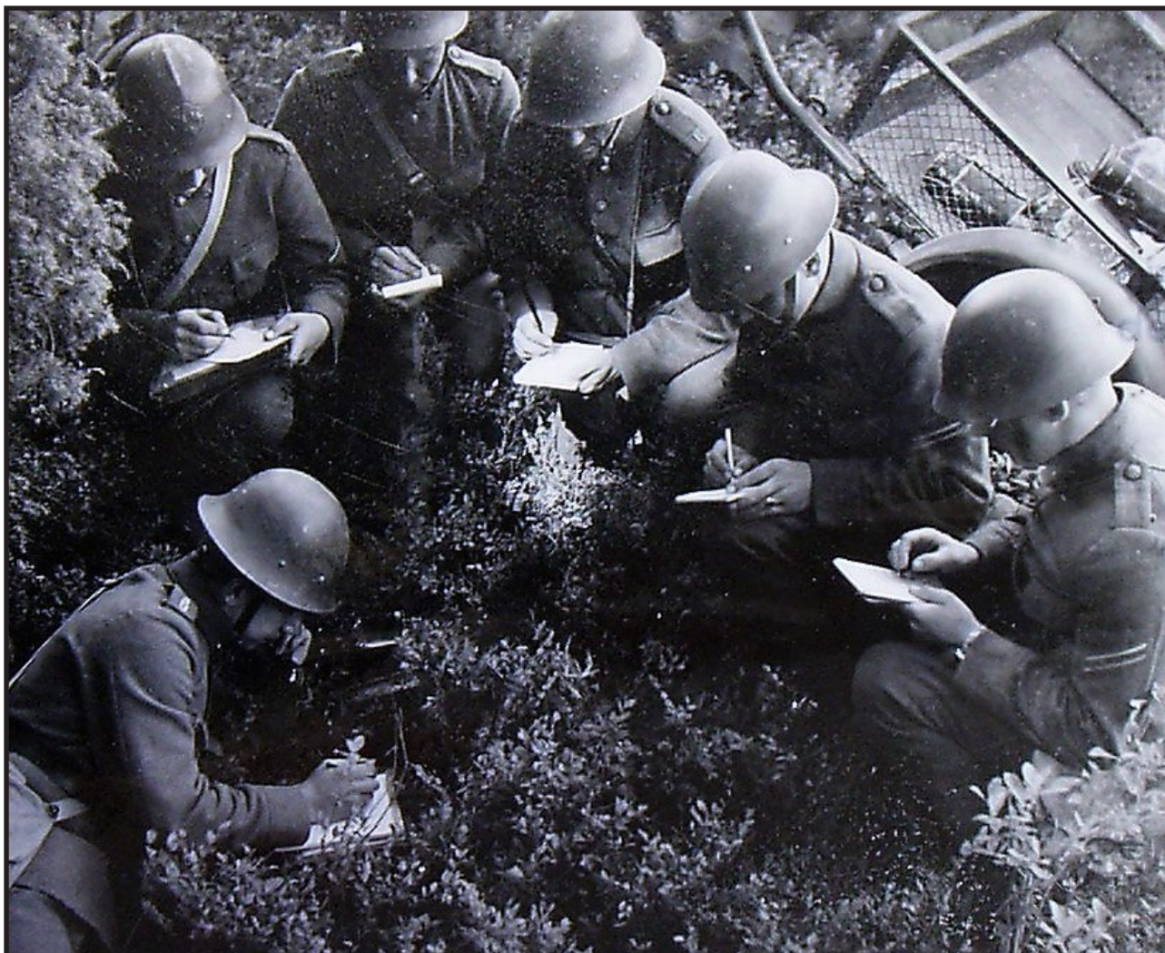
Genomgång vid fälttelefonen. Order tas emot från kompanistaben.

Överste Rålamb upprättade även en plan för hur fiendliga fartyg skulle hindras från att ta sig in i Singöfjärden. Fogdösundet (Fygdströmmen) skulle försvaras ”avvärijande” av en infanteristyrka förlagd på Singö. På militärspråk betyder det att en angripare ska stoppas ”med alla till buds stående medel”. Fienden skulle helt enkelt inte släppas fram. Hur detta skulle gå till utan tyngre vapen framgår dessvärre inte.