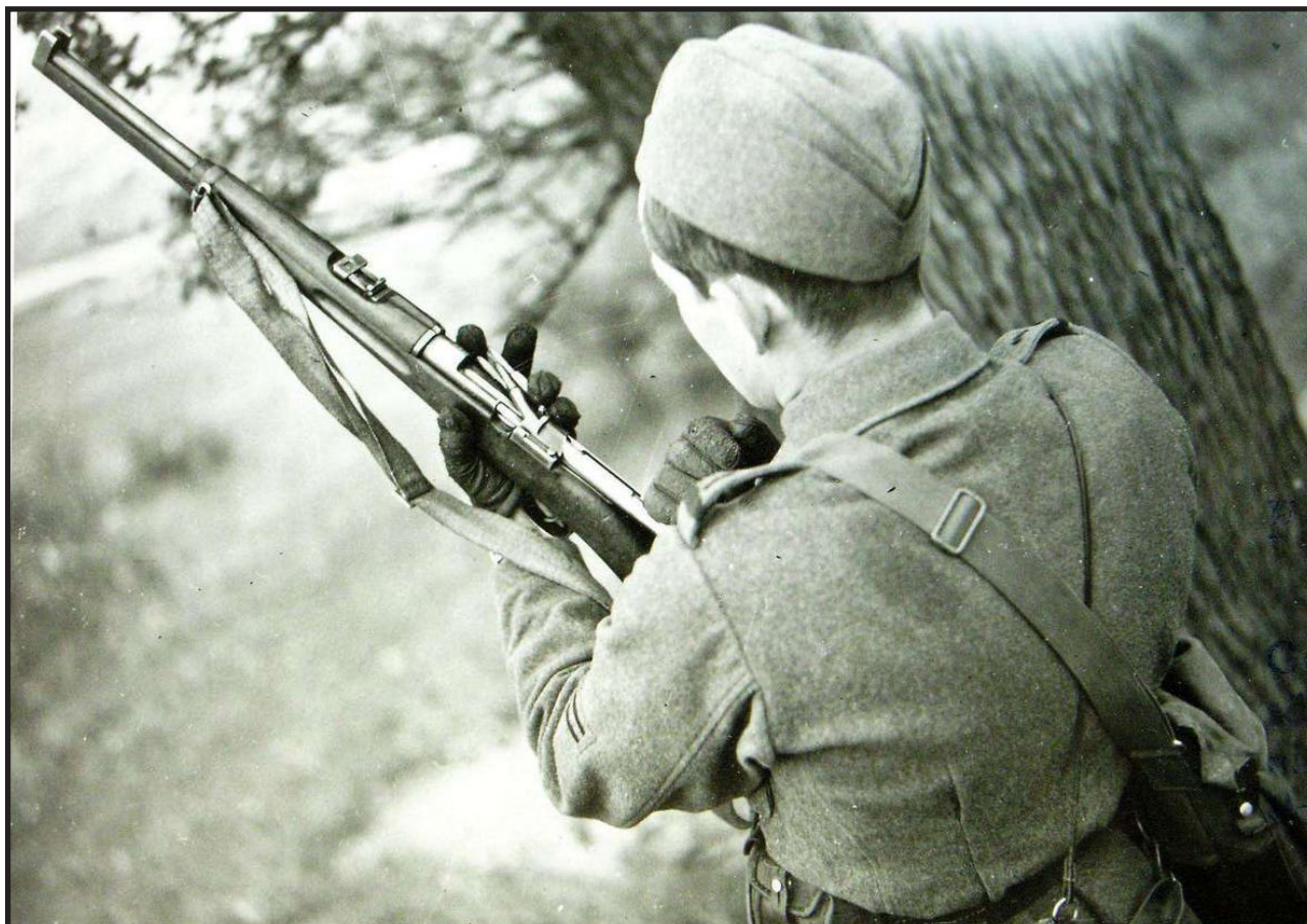
Vapenövningar var en ofta förekommande uppgift för de inkallade.

"Vår beredskap är god", hade statsminister Per Albin Hansson försäkrat i ett tal strax före krigsutbrottet. Det var inte sant, den militära beredskapen var usel. Men febrilt arbete pågick för att göra den bättre.