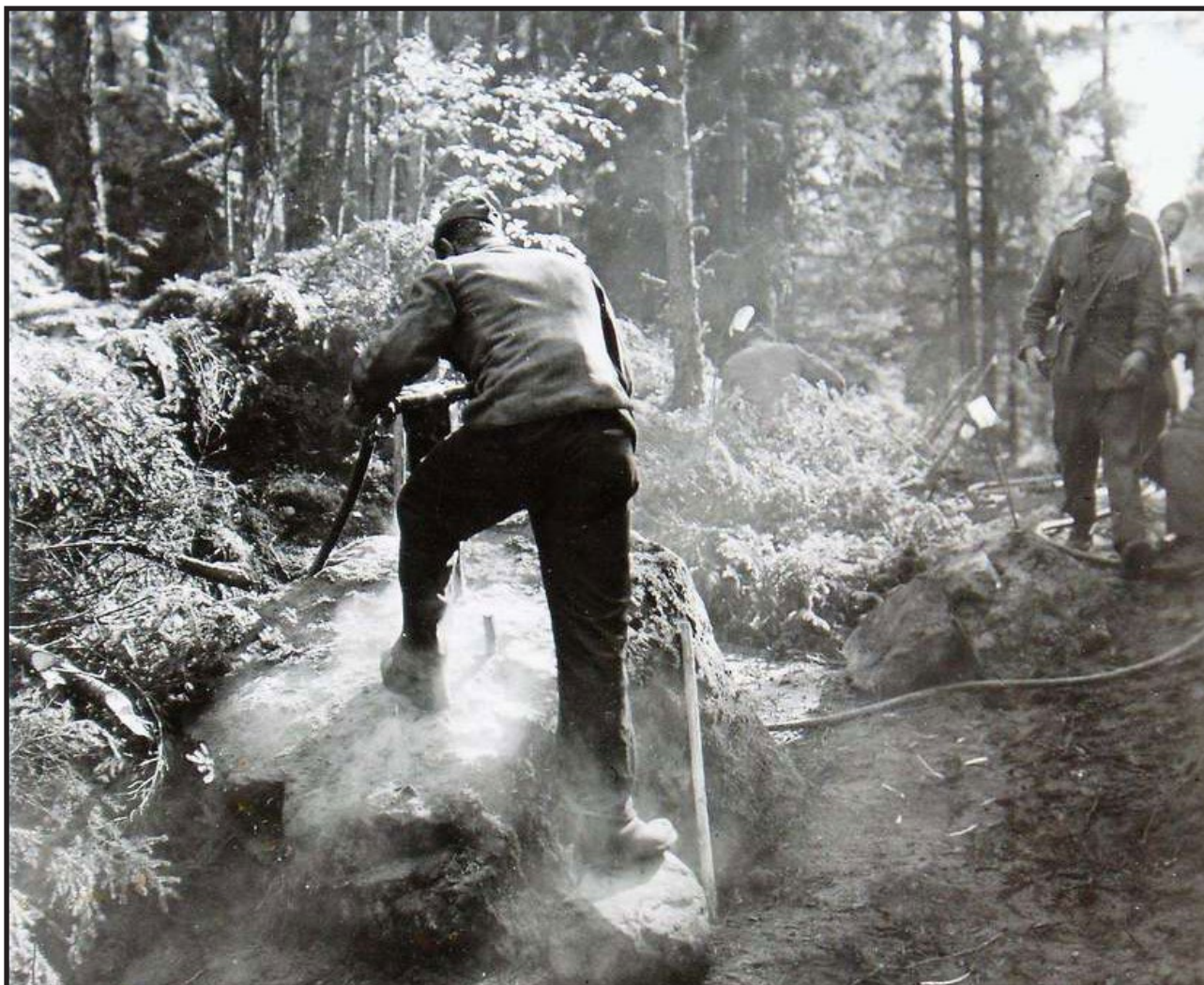
Sverige var i ett pressat läge när skyttevärn och skyddsrum byggdes vid Vaddökusten 1940-41.

enda skott på grund av brist på ammunition. Trängen är ett vapenslag som inte i första hand ska strida utan vara hjälptrupp. Trängen ska se till att stridande förband har drivmedel, ammunition och sjukvård – en slags underhållstjänst. Att sätta ett trängkompani att försvara ett flygfält kändes uppenbarligen inte tryggt för överste Rålamb. Av drygt 100 trängsoldater var endast kompanichefen utbildad på tyngre vapen - som för övrigt inte fanns att tillgå. ”En stor del av för eldgivning erforderlig material fattas ännu, såsom telefoner, avståndsmättningsinstrument, kspkikare m m.” skrev översten. Han hade rekvirerat utrustningen, men visste inte om något fanns att få och när utrustningen i så fall kunde tänkas komma.